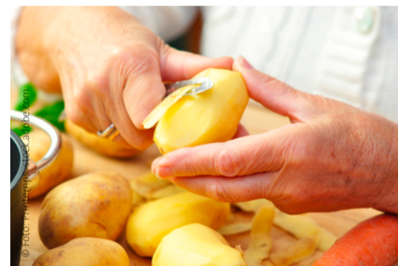
Alltag wie zu Hause – inklusive Kochen

Die Bewohner beteiligen sich im Rahmen ihrer Möglichkeiten an den alltäglichen Aktivitäten und werden von den Betreuungs- und Pflegekräf-