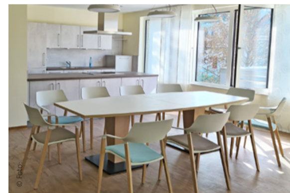
Ein großer Tisch für gemeinsame Mahlzeiten

Die Wäsche wird gemeinsam gewaschen und das Assistenz-Team hält auch gemeinsam mit den Mietern die Gemeinschaftsräume sauber. Die privaten Zimmer müssen selbst oder von den Angehörigen gereinigt werden. Wie zu Hause auch kommt der ambulante Pflegedienst, um alle zu versorgen, die medizinische oder pflegerische Hilfe benötigen.