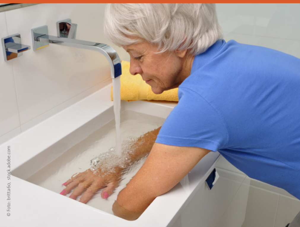
Autorin: Sabine Anne Lück © Gepflegt zu Hause