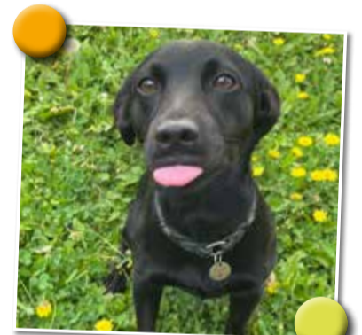
Ein charmanter Frechdachs erobert die Herzen.

Ein weiterer wunderbarer Aspekt meiner Arbeit ist die Förderung des sozialen Miteinanders. Oft werde ich zum Mittelpunkt der Aufmerksamkeit und das bringt die Menschen