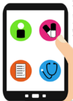
Autorin: Sabine Anne Lück © GEPFLEGT ZU HAUSE

Unterstützung für ein gesundes Leben bieten inzwischen viele Apps. Beliebt ist das Messen der eigenen Vitalwerte.